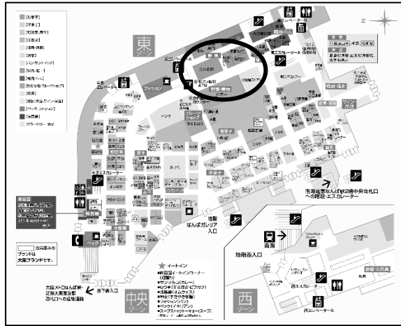
大阪高島屋の「海魚黒門」